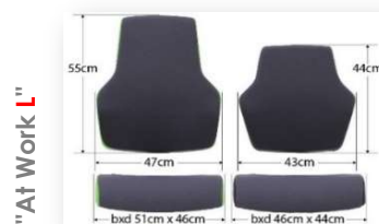
"At Work L"