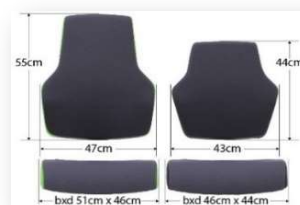
"At Work L"